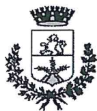
Comune di Tavagnacco