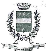
Comune di Pradamano