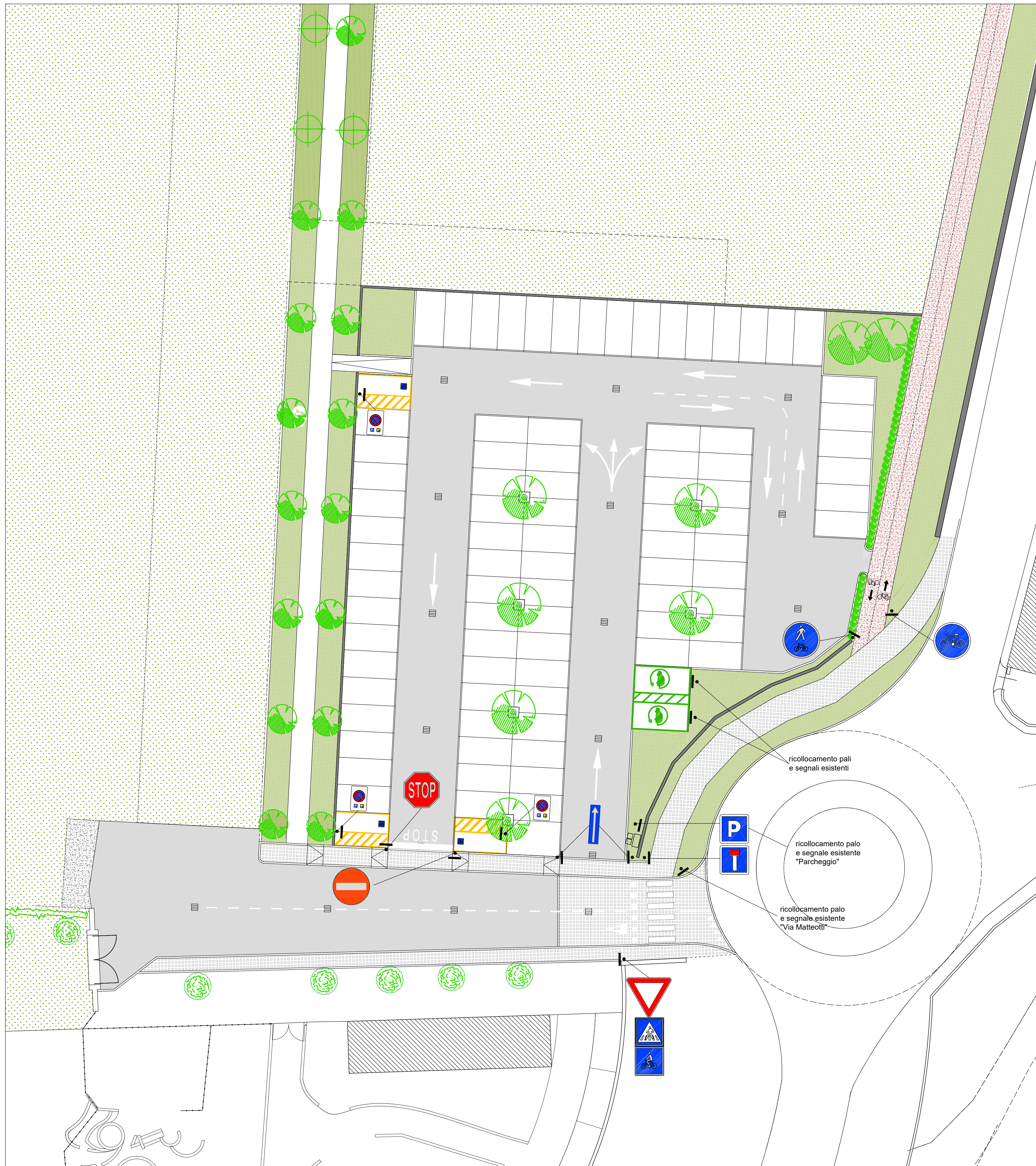
PLANIMETRIA GENERALE - Scala 1:200