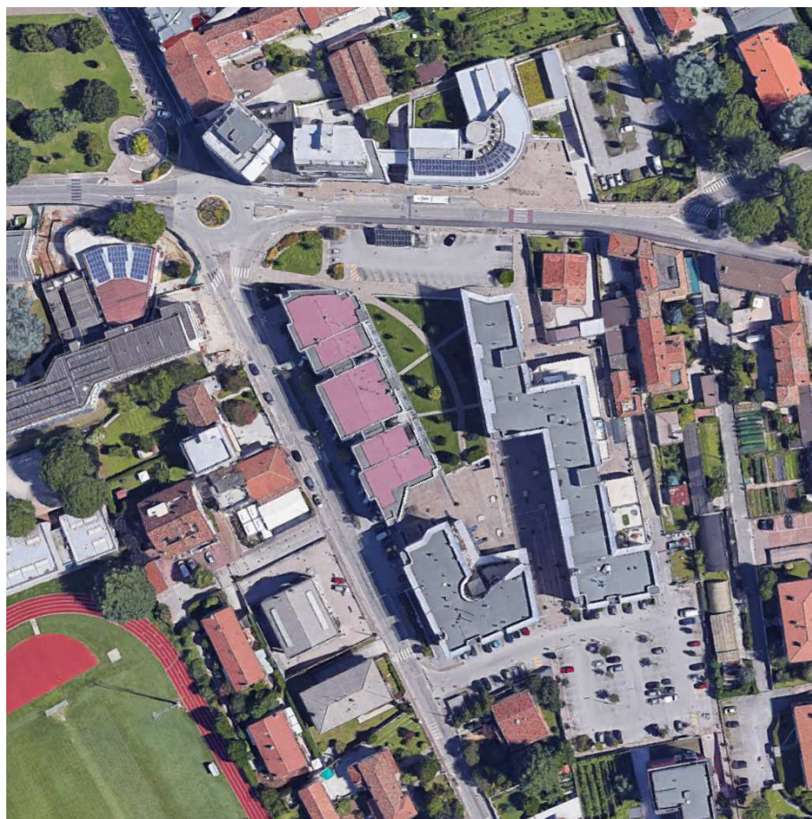
Figura 1 – Inquadramento generale