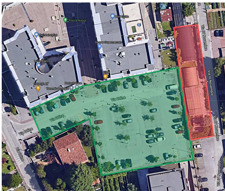
Figura 2 – Inquadramento parcheggio esistente prossimo a Via Udine (colore verde) e area destinata all'ampliamento del parcheggio esistente (colore rosso)