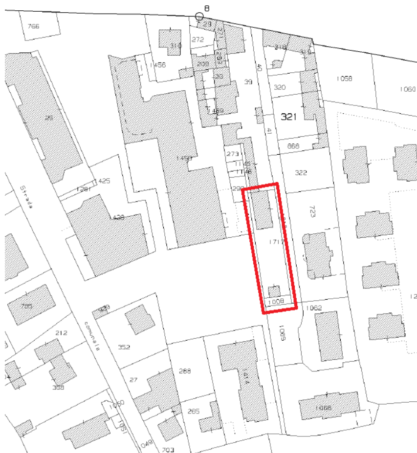
Figura 3 – Estratto catastale Fig.29, evidenziate in rosso le particelle mapp.1008 e 1717 oggetto di procedura espropriativa

Costituisce parte integrante del progetto di fattibilità tecnico economica l'elaborato denominato "piano particellare d'esproprio" in cui sono indicate le particelle oggetto di espropriazione e di cui si riporta un estratto catastale: