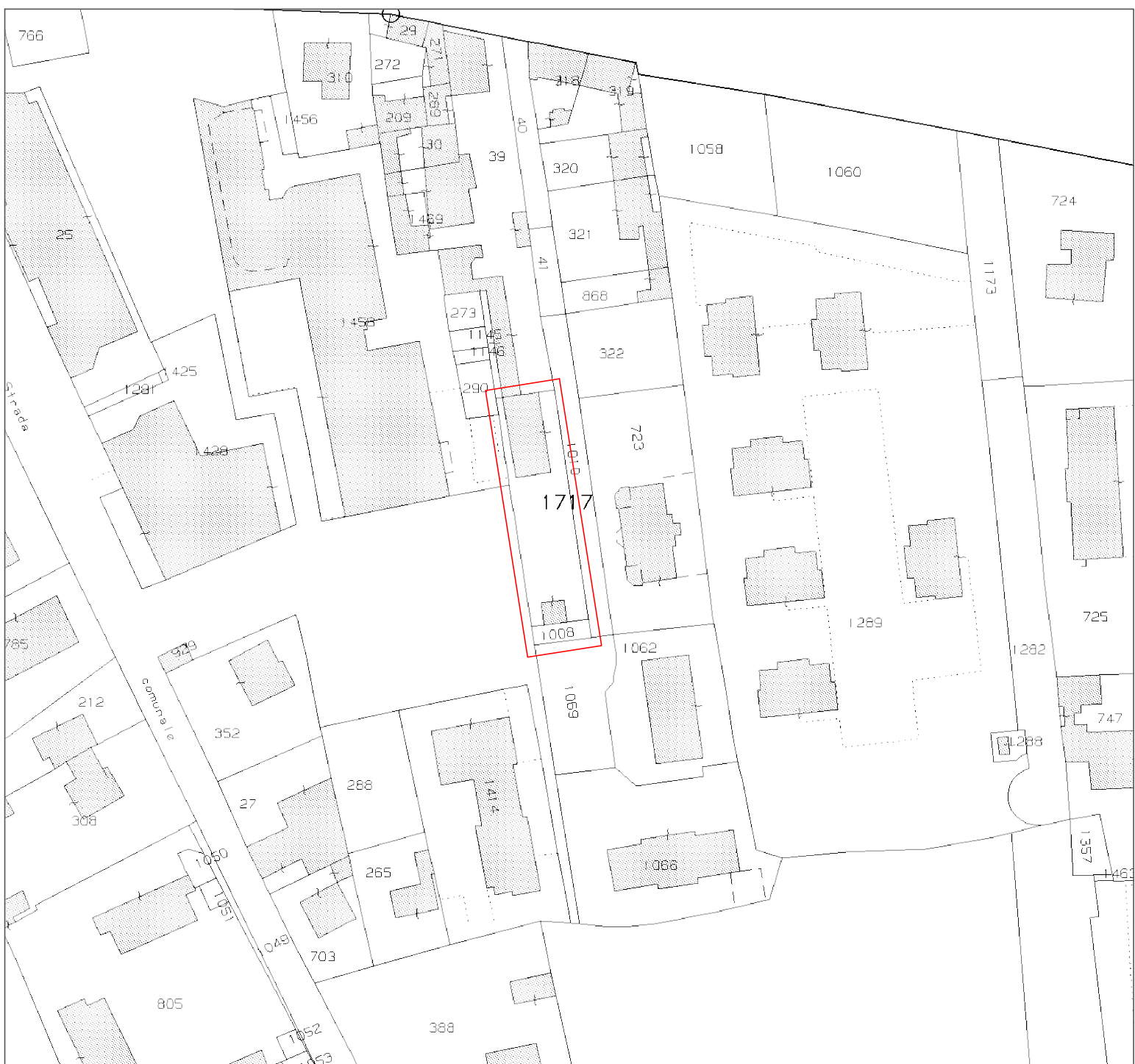
INQUADRAMENTO CATASTALE AREA DI INTERVENTO - Estratto di Fg.29 Mappali 1717 e 1008