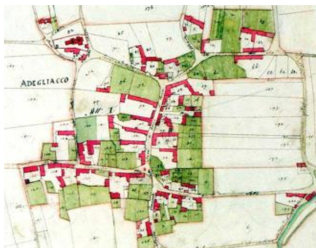
Fig: Catasto antico della frazione di Adegliacco: si leggono chiaramente i principi insediativi delle corti e le sequenze di spazi.

LE SEQUENZE: nel tessuto antico è possibile riconoscere delle precise sequenze di spazi che vanno dalla strada fino agli orti e ai campi, formate da: fronte su strada, sempre chiuso da edifici a filo strada o muri alti di recinzione, con portoni o "androni" che danno accesso alle corti interne - cortile centrale interno libero - edificio principale o annessi (accessori, depositi) - orti e piccoli depositi agricoli - vigneti, frutteti - campagna. Gli interventi di recupero dovranno mantenere androni e portoni che segnano i passaggi tra i differenti spazi.