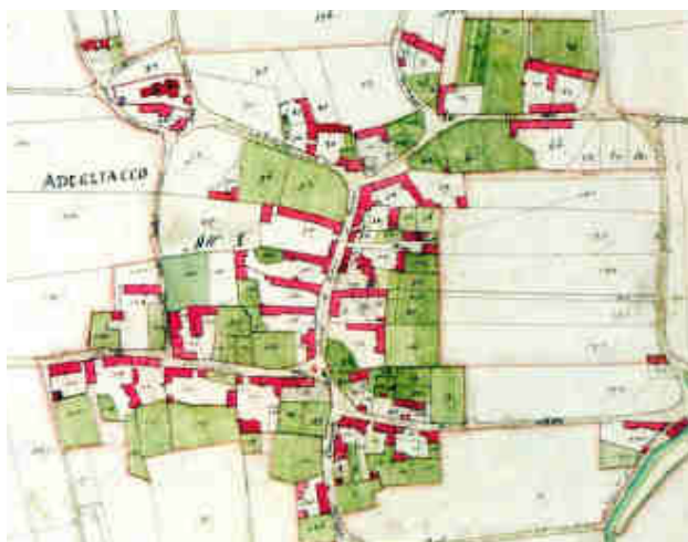
Fig: Catasto antico della frazione di Adegliacco: si leggono chiaramente i principi insediativi delle

LE SEQUENZE: nel tessuto antico è possibile riconoscere delle precise sequenze di spazi che vanno dalla strada fino agli orti e ai campi, formate da: fronte su strada, sempre chiuso da edifici a filo strada o muri alti di recinzione, con portoni o "androni" che danno accesso alle corti interne - cortile centrale interno libero - edificio principale o annessi (accessori, depositi) - orti e piccoli depositi agricoli - vigneti, frutteti - campagna. Gli interventi di recupero dovranno mantenere androni e portoni che segnano i passaggi tra i differenti spazi.